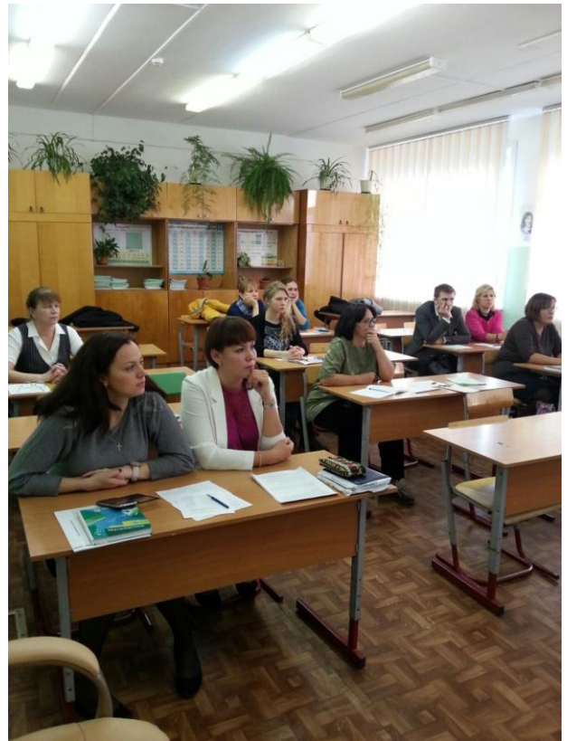
Руководитель окружного ресурсного центра (опорного учреждения)